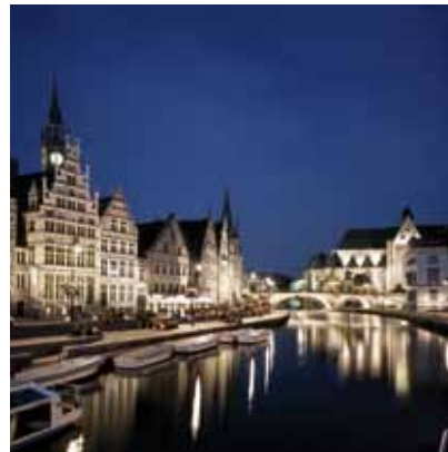
2004 - Gent - België