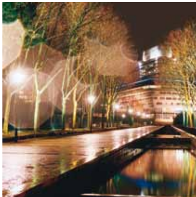
2003 - Cergy - Frankrijk