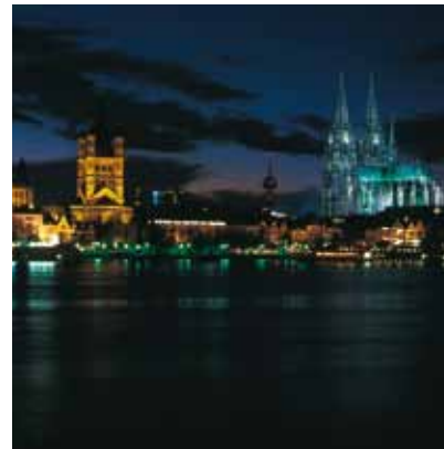
2005 - Keulen - Duitsland