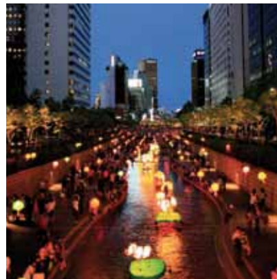
2008 - Seoul - Korea