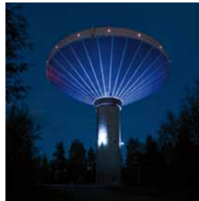
2009 - Jyväskylä - Finland