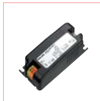
Philips HID-PrimaVision Mini gear 35W & 70W