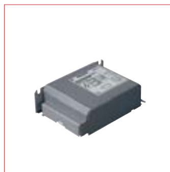
Philips HID-PrimaVision 35W i 70W