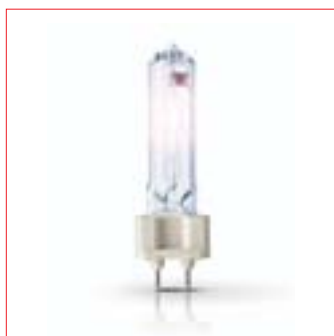
Philips MASTERColour CDM-T Elite