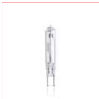
Philips MASTERColour CDM-TC Elite