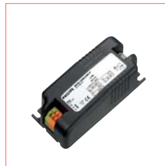
Ballast Philips HID-PrimaVision Mini 35W