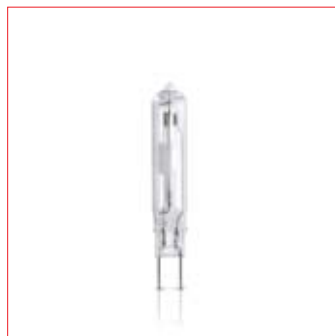
Philips MASTERColour CDM-TC Elite