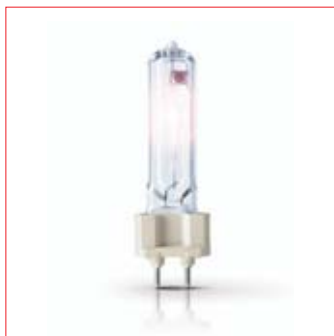
Philips MASTERColour CDM-T Elite