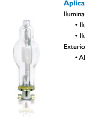
Lámpara Philips MASTERColour CDM-Tm Mini 35W