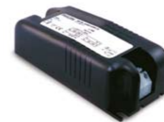
Philips HID-PrimaVision Mini-System mit Philips MASTERColour CDM-Tm Mini